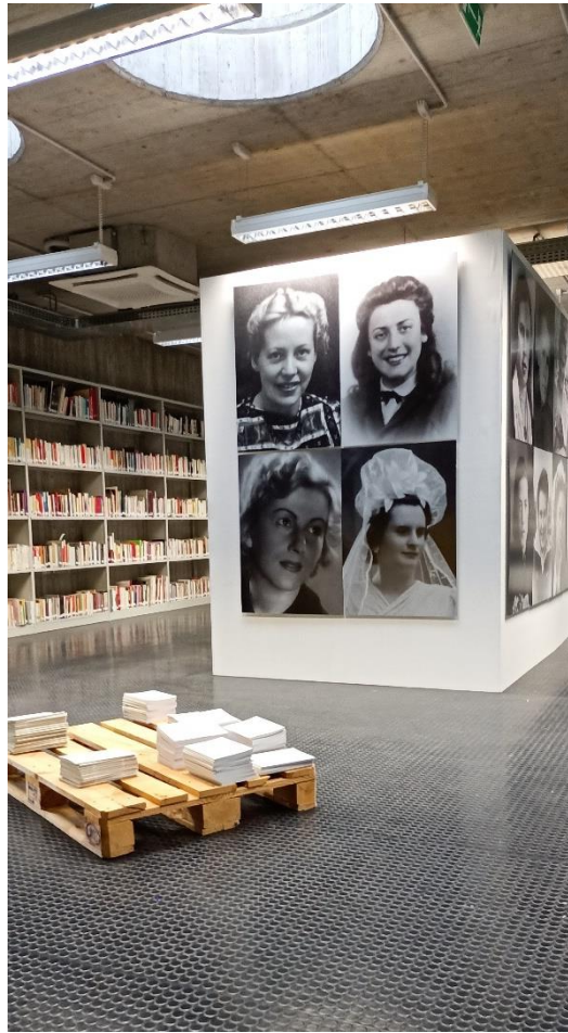
3 Casa della Memoria, Mailand