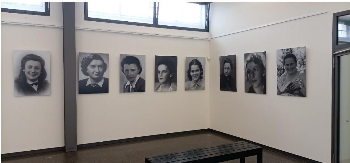
1 Gedenkstätte Ravensbrück

Das Internationale Ravensbrück Komitee und die Gedenkstätte Ravensbrück entwickelten diese Ausstellung gemeinsam. Die Eröffnung fand am 18. April 2021 zum 76. Jahrestag der Befreiung in der Gedenkstätte Ravensbrück statt.