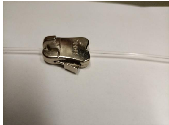
1 Beispiel eines Hakens für die Hängung

Die Porträttafeln besitzen auf der Rückseite eine Leiste, an der diese, z.B. mit Haken, mit einem Hängesystem verbunden werden können. Pro Porträttafel werden zwei Punkte (Haken) zum Aufhängen benötigt.