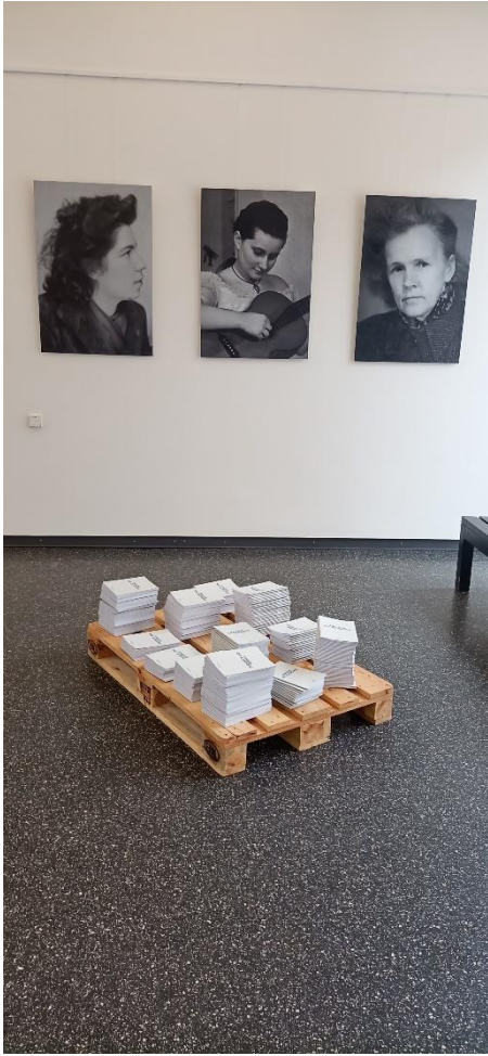
2 Gedenkstätte Ravensbrück