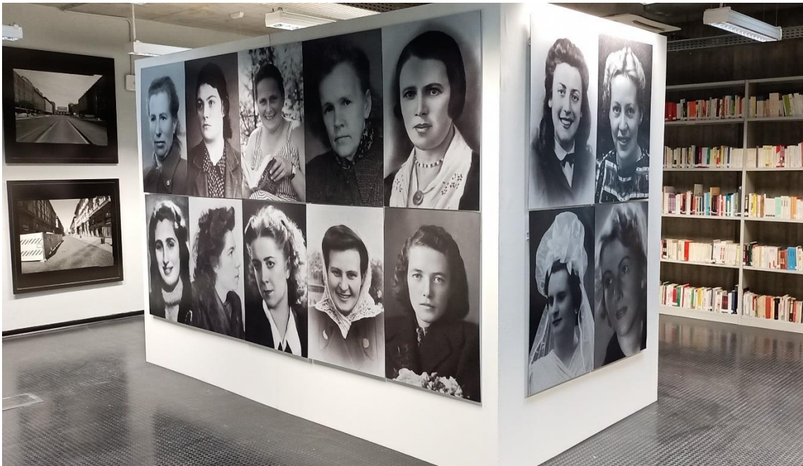
4 Casa della Memoria, Mailand