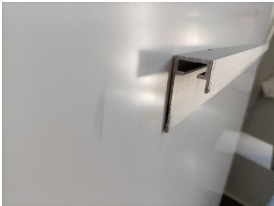
2 Leiste zur Hängung auf der Rückseite